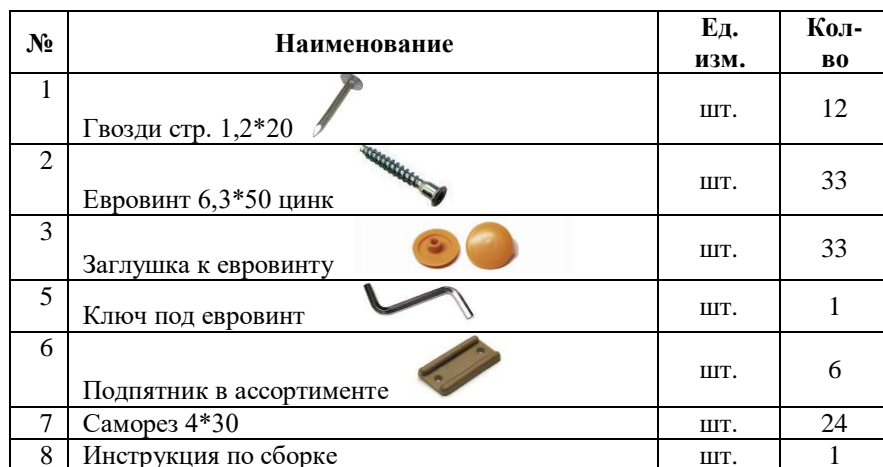
Таблица 2 Комплектующая ведомость на фурнитуру

Внешний вид фурнитуры на картинке может отличаться от внешнего вида фурнитуры, идущей в комплект